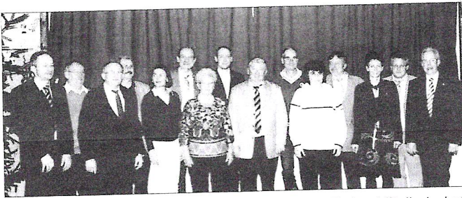
25, 40 und 50 Jahriges Mitgliedschaft

Passend zur Weihnachtszeit sollte eine Verlobung unterm Christbaum stattfinden, wozu ein schrager Punker erhalten musste, um die Eltern wunschgema auf Jeden