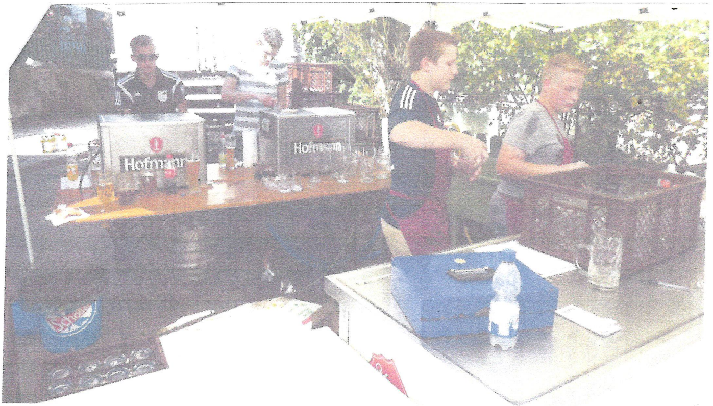
Auch das „Junioren-Schankteam“ ist bereit.