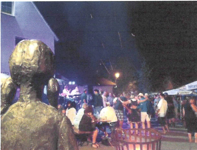
mehr Dorffest geht nicht. Aus der Sicht des Dorfbrunnens vor der Feuerschale und den tanzenden Besuchern

Erst zum frühen Morgen haben auch die letzten Besucher in ihr Bett gefunden. Dennoch waren pünktlich zum Abbau um 9 Uhr schon wieder viele motivierte Helfer/Innen am Werk, um den Dorfplatz aufzuräumen und alles abzubauen. Innerhalb von 2 1/2 Stunden hat man von dem stimmungsvollen Abend zuvor schon fast nichts mehr gesehen.