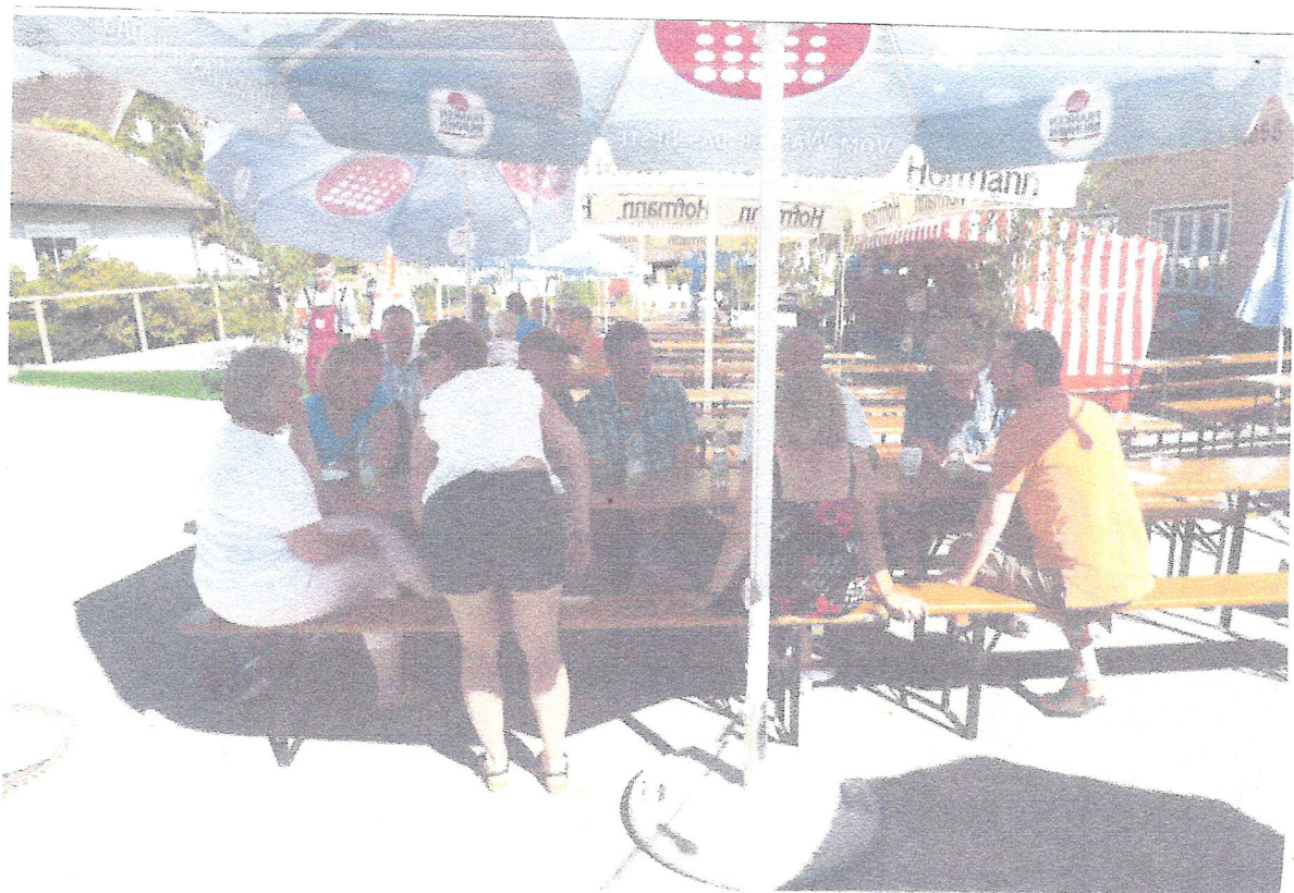
Schon sind die ersten Gäste da.