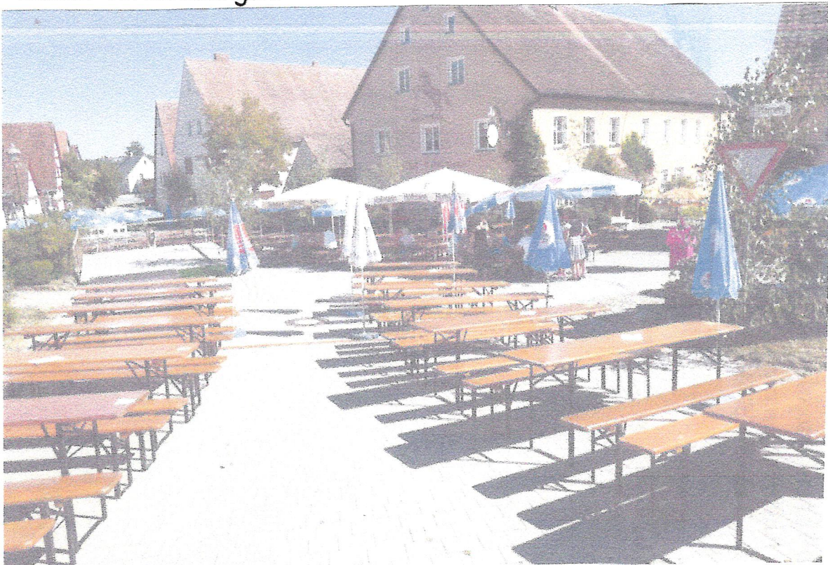
Tische und Bänke warten auf die Gäste.